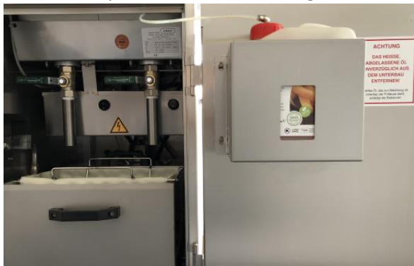
Kanisterhalter mit Sichtfenster

Hier am Beispiel Kienle Fritteuse eingebaut: